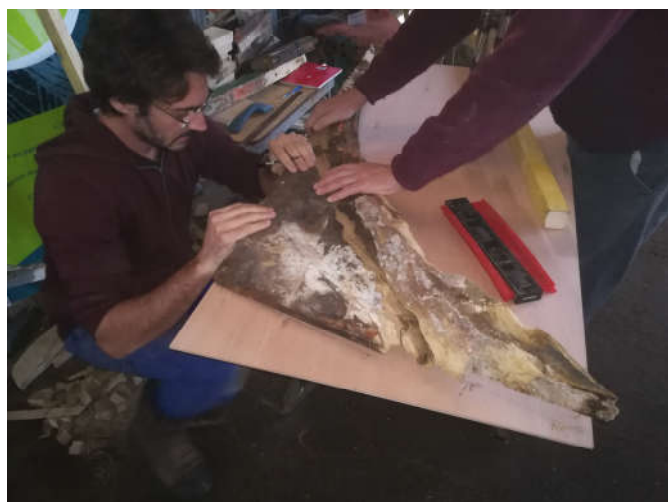
Traçage du gabarit de la courbe d'étambot

Lors de la visite de notre charpentier de marine nous avons tracé le gabarit de la courbe d'étambot, et relevé la trace du "retour de galbord". C'est l'endroit où la virure de galbord (la dernière virure de bordé qui est fixée sur la quille) porte sur la quille, un élément essentiel pour l'étanchéité de la coque !