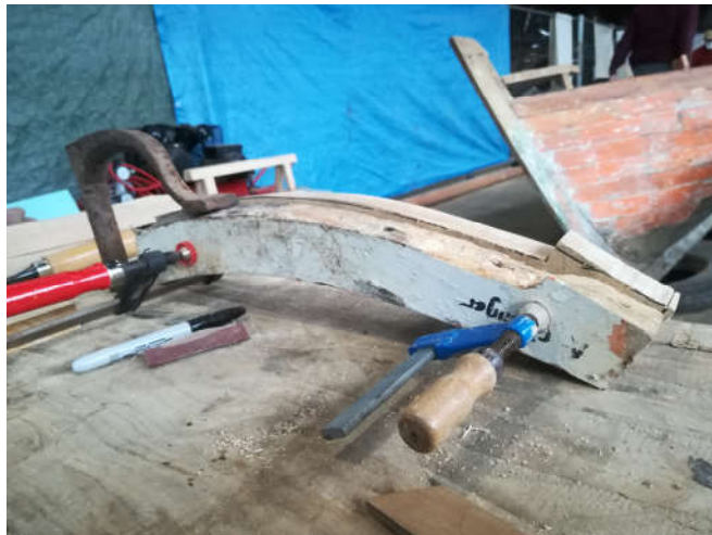
Confection des nouveaux couples

Les virures de bordé arrière ont été coupée et il reste à faire les préparations des scarfs et des pièces neuves.