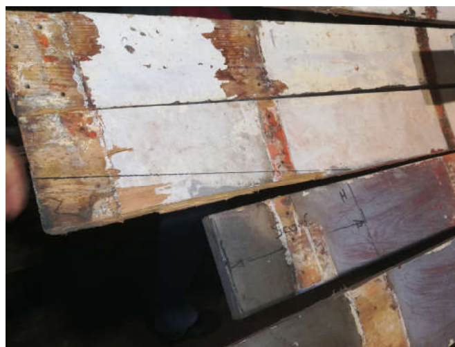
Traçage des coupes